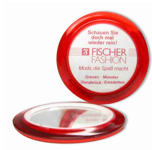
SPIEGEL 74 mm